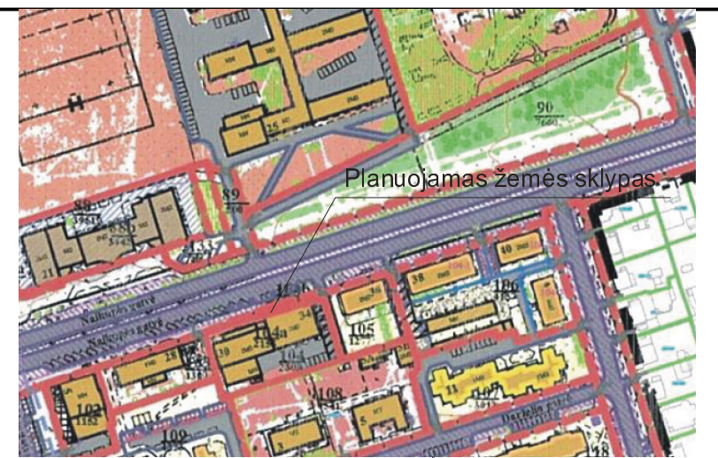
Ištrauka iš 71ha teritorijos tarp Jūreivių g., Poilsio g., Strėvos g. tęsinio, Mityvos g., Žalgirio g., Kalnupės g., Nidos g. ir Rambynų g. detaliojo plano