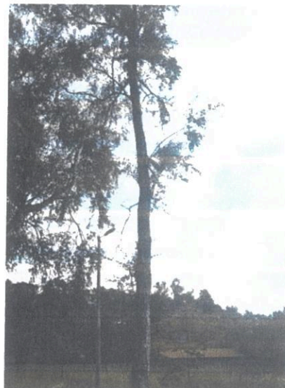
Numatomas kirsti/atsodinti beržas Nr.4

Želdiniai sklypų ribose sprendžiami STR ir kitų teisės aktų nustatyta tvarka arba techninio projekto rengimo metu. Vadovaujantis LR AM 2007-12-21 įsakymu Nr. D1-694 „Dėl atskirųjų rekreacinės paskirties želdynų plotų normų ir priklausomųjų želdynų normų (plotų) nustatymo tvarkos aprašo patvirtinimo“, želdynų, įskaitant vejas ir gėlynus, plotas rekreaciniuose sklypuose ne mažesnis kaip 40 % viso žemės sklypo ploto. Planuojama želdinti sklypų zonas, kuriose nėra numatyta inžinerinių komunikacijų ir jų apsaugos zonų.