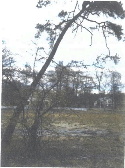
Numatoma kirsti/atsodinti pažeista pušis Nr.2

Šiuo detaliuoju numatoma šalinti esamą pažeistą pušį, kuri plane pažymėta Nr.2 ir esamą beržą Nr.4, kurio būklė yra gera, tačiau medis neturi vizualinės išvaizdos, yra skurdus su mažai šakų. Medžius numatoma atsodinti. Visi kiti vertingi medžiai esantys sklype lieka saugomi. Sklype planuojami sodinti nauji medžiai, kurie atitiks Rekreacinių teritorijų nuo Švyturio g., Melnragės, Girulių iki Karklės dviračių takų, paviršinių nuotekų ir upelių sutvarkymo ir kraštovaizdžio specialiojo plano, patvirtinto Klaipėdos miesto savivaldybės administracijos direktoriaus 2014-07-02 įsakymu Nr. AD1-1999, sprendiniu – pastatai ar kompleksai turi skęsti želdiniuose, nedominuotų savo mase.