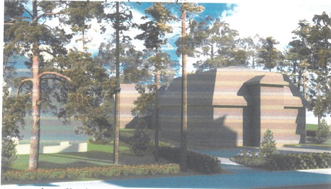
1 pav. Vaizdas nuo jūros pusės į rytus