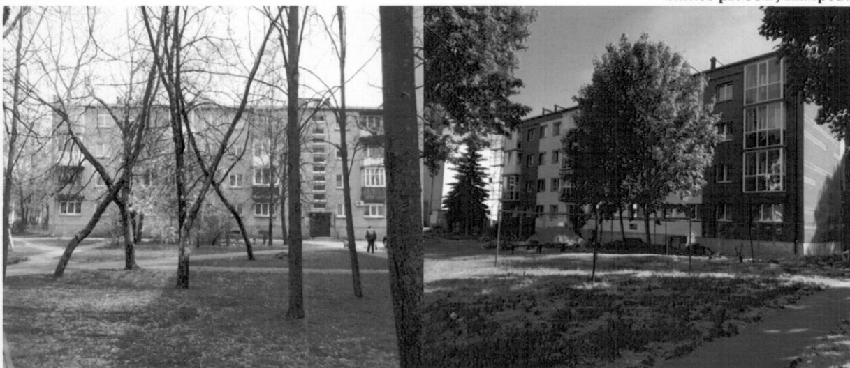
Taikos pr. 35B, Klaipėda

Projekto įgyvendinimo pradžia - 2014 m. Projekto vertė – 261 553 Eur. Namo naudingas plotas – 1225 m 2 Butų ir kitų patalpų skaičius - 32 Projekto administratorius - UAB „Vėtrungės būstas“ Statybos darbų rangovas – UAB „Panevėžio statybos trestas“