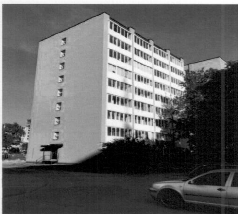
Taikos pr. 41, Klaipėda

Projekto įgyvendinimo pradžia - 2014 m. Projekto vertė - 446 982 Eur. Namo naudingas plotas – 2601 m 2 Butų ir kitų patalpų skaičius - 103 Projekto administratorius - UAB „Vėtrungės būstas“ Statybos darbų rangovas – UAB „RNDV group“