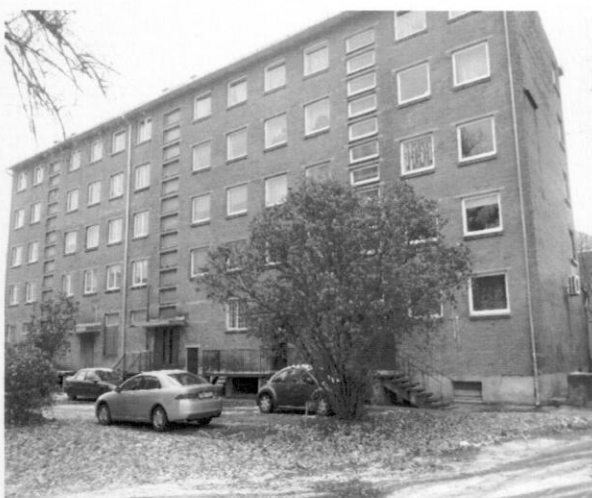
Sulupės g. 7, Klaipėda