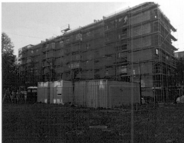
Rumpiškės g. 28, Klaipėda

Statybos darbų rangovas – UAB „Kuršasta“