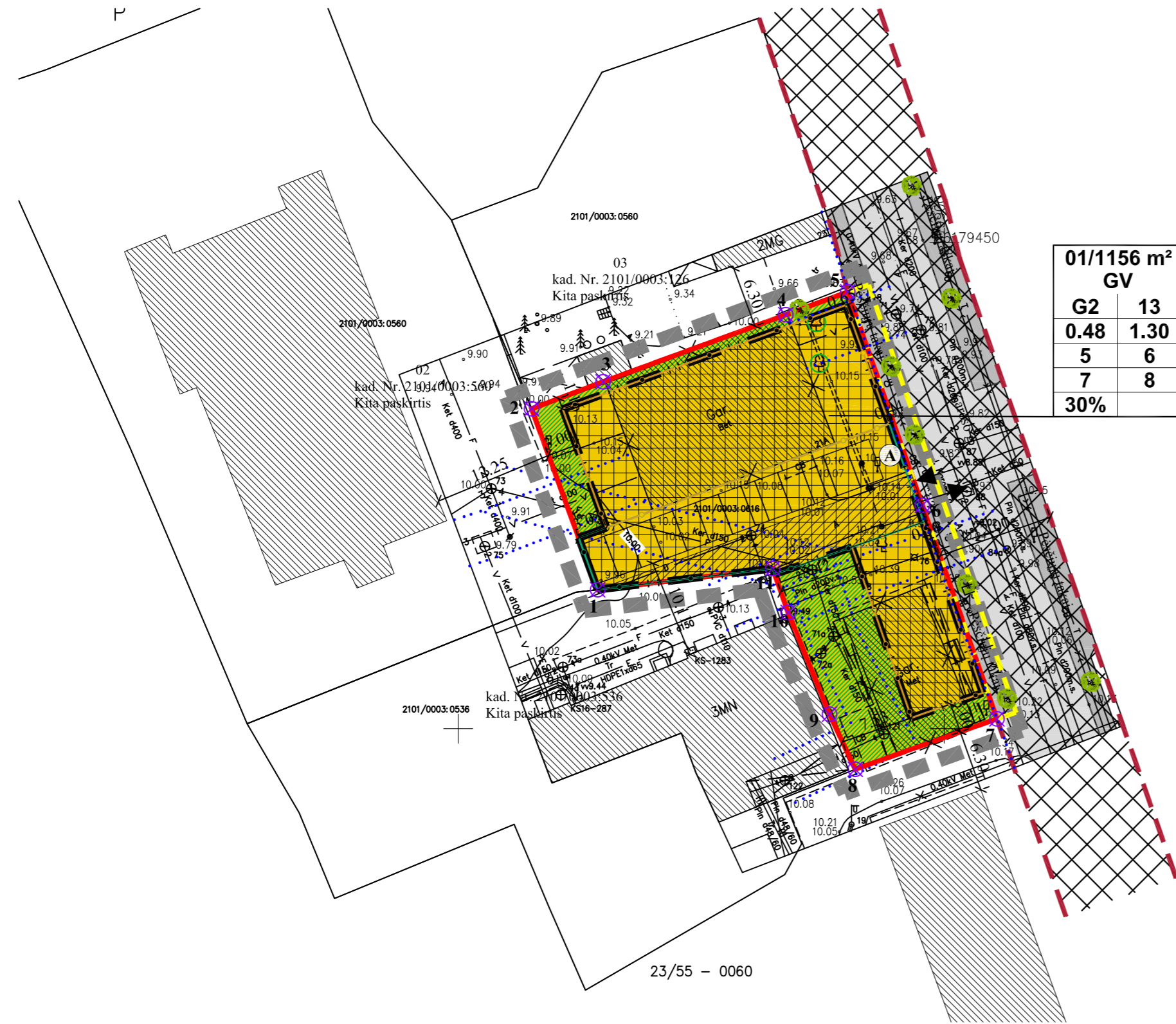
IŠTRAUKA IŠ KLAIPĖDOS RAJONO BENDROJO PLANO SPRENDINIŲ