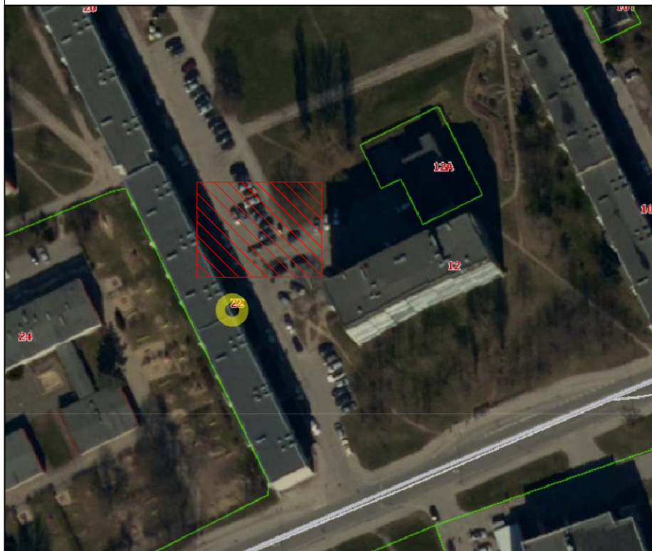
Nr.: 192. Buitinių atliekų konteinerių aikštelės schema Nr.: 1., Debrečeno g. 22, Klaipėda.