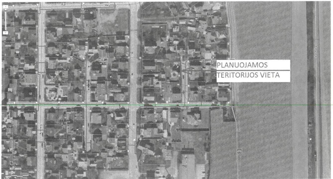
Pav. 1. Orofoto ištrauka su gretimų teritorijų ir kvartalo užstatymu

Detaliojo plano tvarkymo režimo pagrindinių sprendinių aprašomoji lentelė pateikiama pagrindiniame brėžinyje.