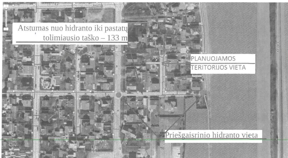
Pav. 2. Situacijos schema

Statiniai turi būti suprojektuoti taip, kad kilus gaisrui: