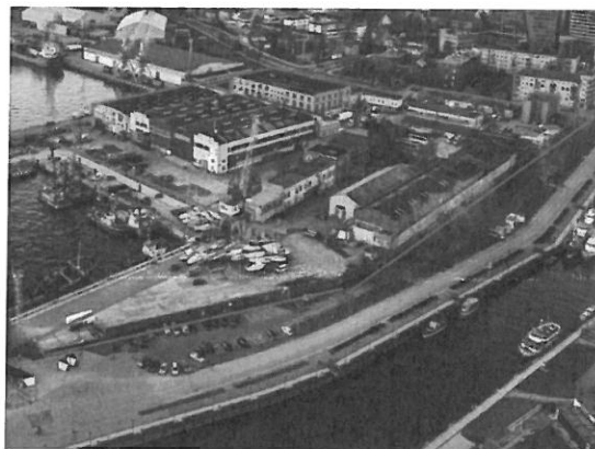
3 pav. Esama situacija projekto teritorijoje

Sutvarkyta teritorija turėtų teigiamą įtaką aplinkiniams rajonams keliais aspektais. Visų pirma, projekto „Startuolių inkubatoriaus įkūrimas Memelio mieste“ startuolių inkubatoriuje kurtųsi aukštą pridėtinę vertę kuriančios inovatyvios ir augančios informacinių technologijų sektoriaus įmonės. Jų atsiradimas projekto teritorijoje didins netoliese esančių paslaugų įmonių paklausą, visų pirma, maitinimo įstaigų. Aukštą pridėtinę vertę ir konkurencingus atlyginimus mokančio verslo atsiradimas projekte vietoje galėtų pagyventi Klaipėdos senamiestį, jame veikiančią paslaugų verslą, kai inkubatoriaus ar kitų projekto „Startuolių inkubatoriaus įkūrimas Memelio mieste“ teritorijoje įsikūrusių įmonių darbuotojai ieškos vietų pietauti ar praleisti vakarą. Šiuo atveju netoliese esantis senamiestis būtų bene patraukliausia kryptis. Kitas aspektas – projekte numatomi pastatyti gyvenamieji namai ir juose projektuojami nauji butai (bendras gyvenamosios paskirties pastatų plotas sudarytų apie 32 311 m 2 ), pritrauks į teritoriją naujų gyventojų, kurie taip pat turės teigiamą įtaką netoliese esančiam paslaugų verslui ar sąlygos jo plėtrą.