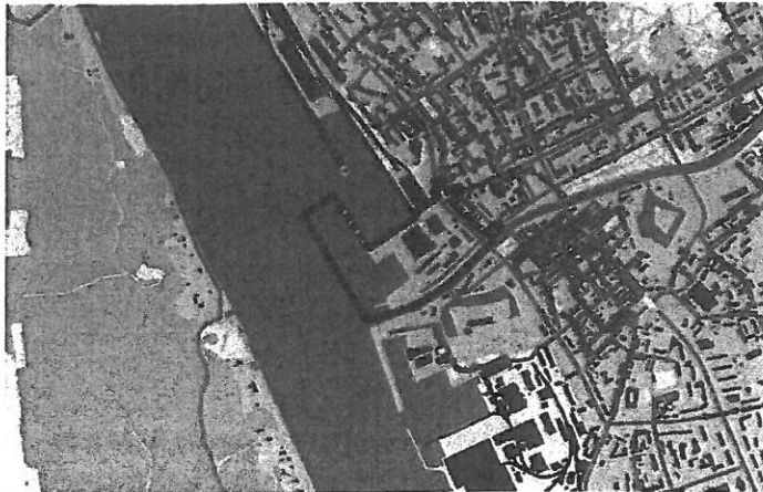
1 pav. Projekto vieta žemėlapyje.

Projektą ketinama įgyvendinti teritorijoje, kurios bendras plotas apie 5 ha, esančioje Klaipėdos m., dešiniajame Danės upės krante, adresu Naujoji Uosto g. 3. Remiantis Klaipėdos miesto teritorijos bendrojo plano keitimo koncepcija, visai netoli projekto teritorijos, Naujo Sodo gatvės tašoje numatoma formuoti naują teritoriją kruizinių laivų terminalui, taip šalia projekto teritorijos yra Danės upė, su nutiestais dviračių takais, jungiančiais Smiltynės perkėlą, Girulius bei Melnragę, Klaipėdos senamiestis, o už 400 m viena pagrindinių jo gatvių – Tiltų g.