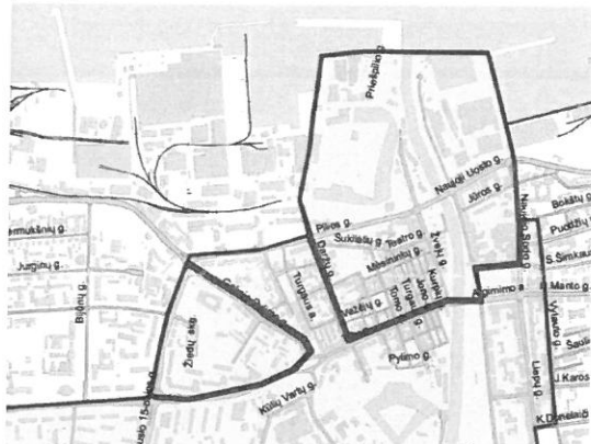
2 pav. Susietos teritorijos ribos

Projekto vieta pagal Klaipėdos miesto integruotą investicijų teritorijos vietos veiklos grupės 2016 – 2022 metų vietos plėtros strategiją priskiriama susietos teritorijos kategorijai (žr. 2 pav.) 6 . Šiuo metu projekto teritorijoje esantys įvairūs sandėliavimo paskirties pastatai, nekuria pridėtinės vertės netoliese esančiam Klaipėdos senamiesčiui, Klaipėdos miestui ir regionui, kuriant patrauklią aplinką turistams ir miestiečiams centrinėje miesto dalyje (žr. 3 pav.).