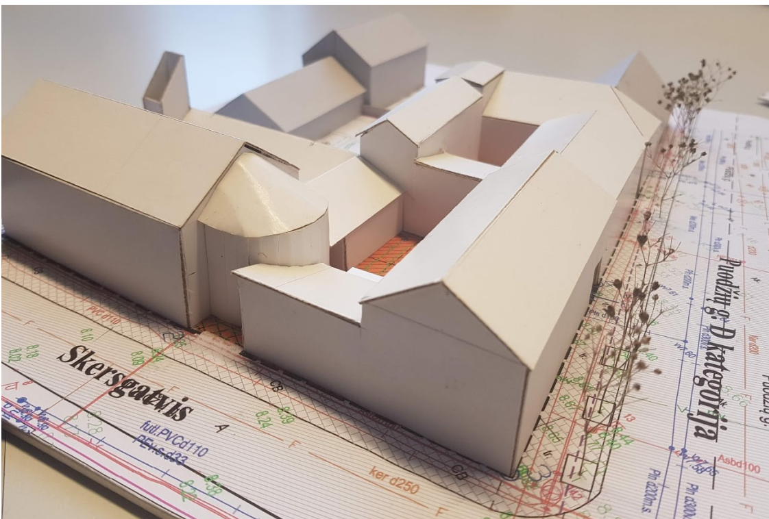
1 pav. Vaizdas iš Puodžių g.- Skersgatvio kampo