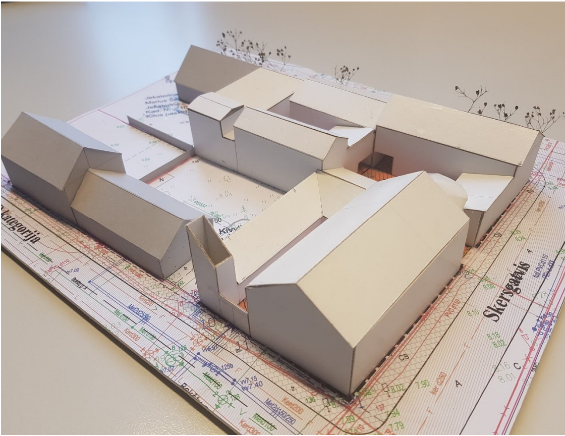
2 pav. Vaizdas iš Bokštų g. – Skersgatvio kampo