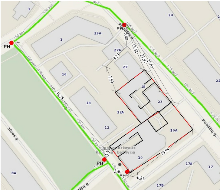
Hidrantų išdėstymo svhema.

Gaisro gesinimui iš išorės atveju vandenį numatoma imti iš keturių, norminiu atstumu nuo pastatų esančių hidrantų – Puodžių gatvėje, Bokštų gatvės ir skersgatvio sankirtoje, Bokštų gatvės ir Krovėjų gatvės sankirtoje bei Gegužės ir Bokštų gatvės sankirtoje. Žiūrėti žemiau pateiktą schemą.