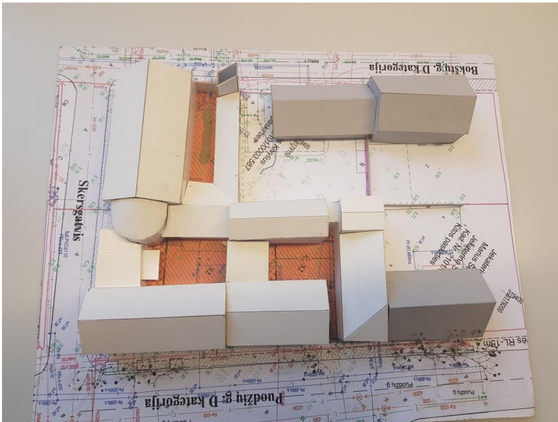
4 pav. Vaizdas iš viršaus