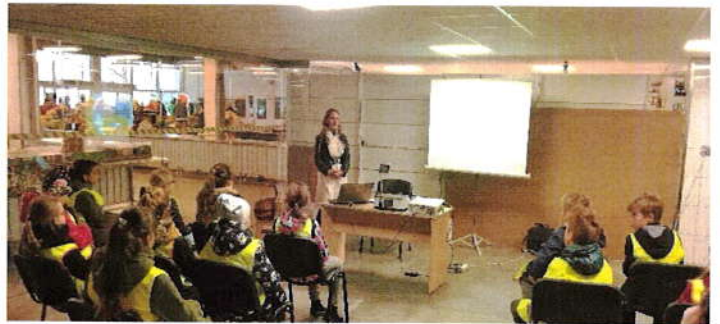
6 pav. Edukacinė pamoka turguje

2019 metais įgyvendinta edukacinių pamokų priemonė susilaukė didžiulio Klaipėdos miesto švietimo įstaigų susidomėjimo, todėl priemonę planuojama įgyvendinti ir 2020 metais. Nors moksleivių edukacija nėra tiesioginė turgaus funkcija, tačiau tai lyg investicija į ateitį, žaismingų užsiėmimų