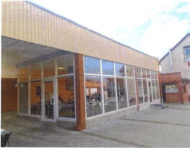
5 pav. Įrengtos valgyklos patalpos nuomą.

operatorių. Tačiau sukurtos tinkamos ir patrauklios infrastruktūros dėka pavyko pritraukti net 3 maitinimo operatorius. Šiuo metu turgavietėje be toliau dirbančių greito maisto užkandinių ir kepyklėlės, sėkmingai veiklą vykdo kavinė „Laimingos šakutės“, valgykla „Smakas“ ir kulinarija „Bono bazar“.