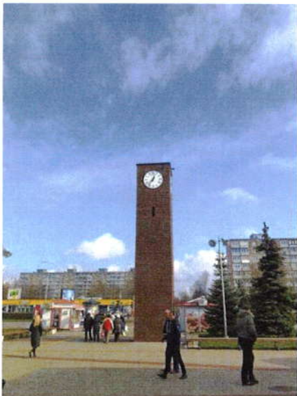
7 pav. Laikrodžio bokštas

UAB „Naujasis turgus“ valdo didelį nekilnojamąjį turtą – trys prekybiniai paviljonai, 3,24 hektarų teritorija. Visa infrastruktūra reikalauja nuolatinio atnaujinimo ir tobulinimo, pritaikant ją prekybinei veiklai ir darant patogią ir patrauklią pirkėjui. Įgyvendinus UAB „Naujasis turgus“ lauko turgavietės ir pėsčiųjų tako Taikos pr. 80, Klaipėda rekonstrukcijos projektą, vykdomi kiti infrastruktūros gerinimo darbai.