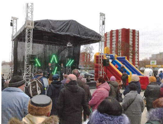
8 pav. Šventė turguje

2019 metais Naujajame turguje buvo rengta įmonės 30-tojo gimtadienio šventė ir keletas mugių. Organizuojamos mugės didina pirkėjų srautus, o taip pat pritraukia naujų prekybininkų iš visos Lietuvos.