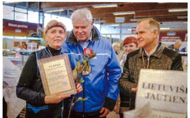
3 pav. Ilgamečių prekyautojų sveikinimas

2019 metais parengtame ir patvirtintame 2019 – 2021 metų strateginiame plane numatyti svarbiausi įmonės strateginiai tikslai: