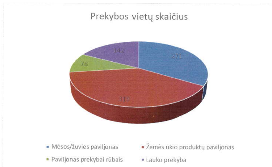
1 pav. Prekybos vietų pasiskirstymas

Vidutinis UAB „Naujasis turgus“ darbuotojų skaičius 2019 metais – 26. Iš jų 5 administracijos darbuotojai, 9 inspektorės, 4 kasininkės – valytojos, 3 pagalbiniai darbininkai, 3 sargai. Per 2019 priimti 4 darbuotojai, atleisti – 5.