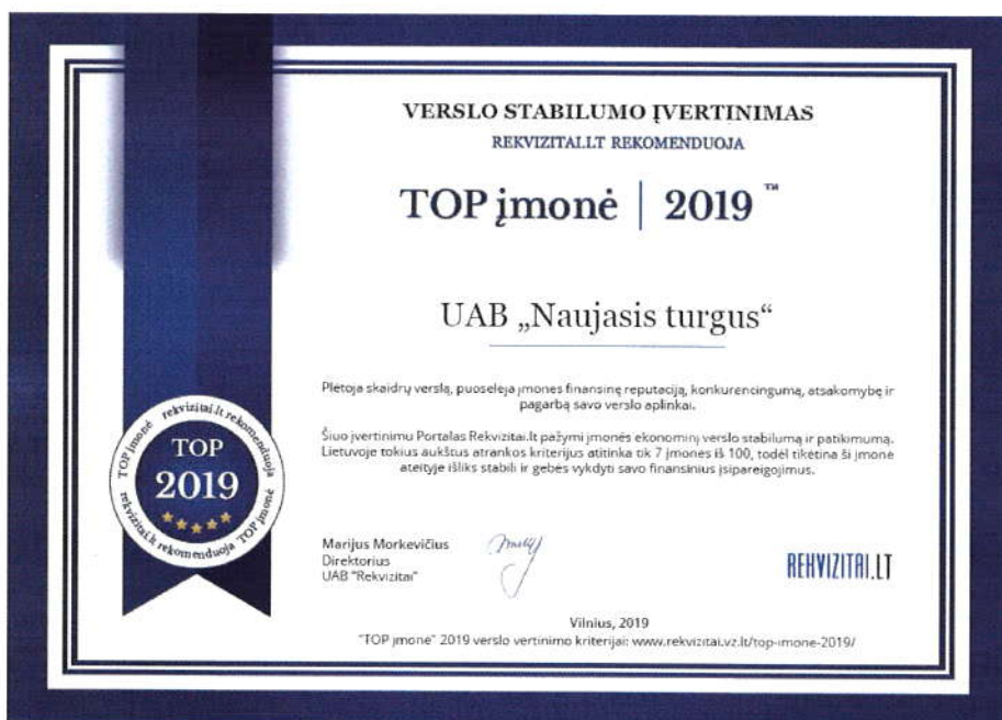
9 pav. rekvizitai.lt diplomas

2019 metais UAB „Naujasis turgus“ veikla įvertinta prestižiniais apdovanojimais.