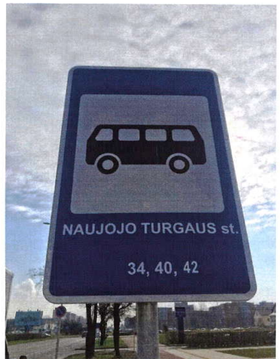
11 pav. Naujojo turgaus stotelė

UAB „Naujasis turgus“ iš perkeltų autobusų maršrutų tikisi didesnių pirkėjų ir pardavėjų srautų.