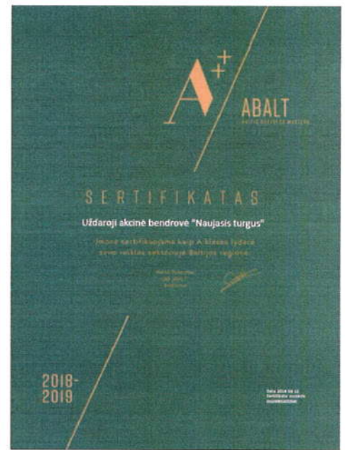
10 pav. ABALT sertifikatas

2019 metais UAB „Naujasis turgus“ savo iniciatyva konkurso būdu parinko nepriklausomą auditorių įmonės 3 metų veiklos audito atlikimui. Skelbtą konkursą laimėjo UAB „Veiklos auditas“, kuris atliko 2016 – 2018 metų UAB „Naujasis turgus“ veiklos auditą. Pagal pateiktas išvadas ir rekomendacijas parengtas ir įgyvendinamas trūkumų šalinimo planas.