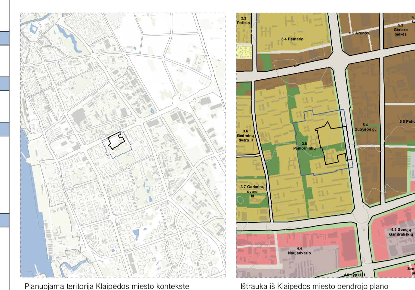
Panorama teritorija Klaipėdos miesto kontekste, Straukla 6 Klaipėdos miesto bendrojo plano