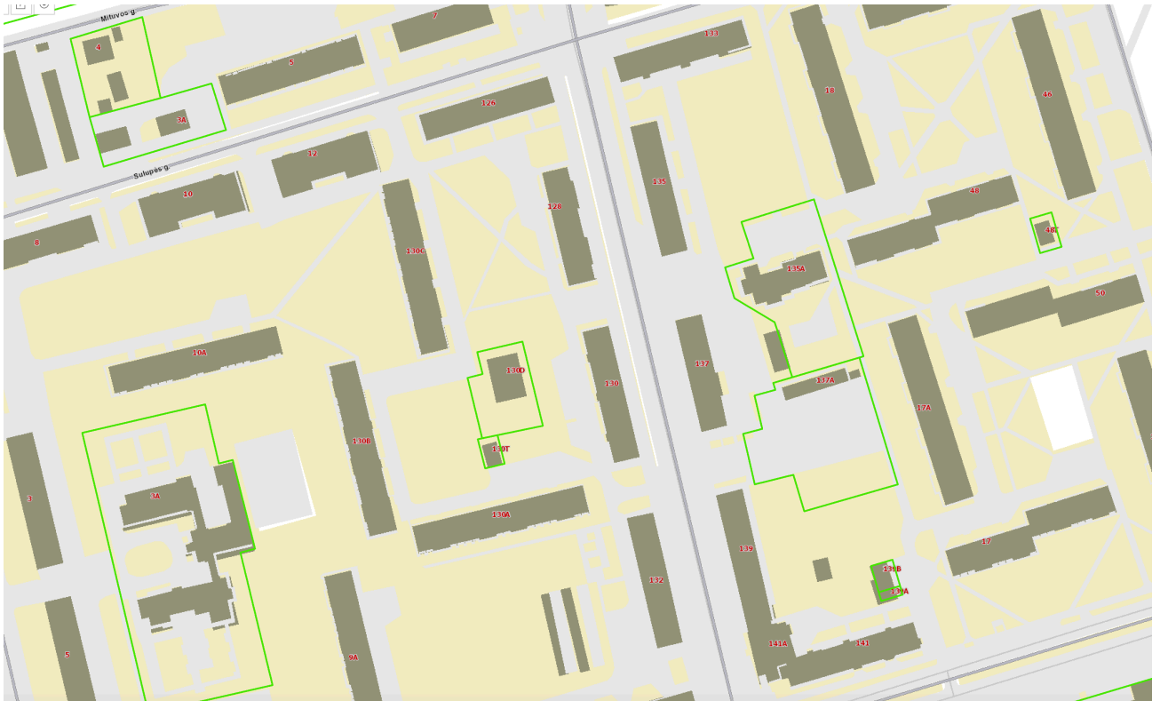
Pav. 1. Sklypo situacijos schema.

2002 m. parengtame detaliajame plane sklypui Nr.02 nustatyti teritorijos naudojimo reglamentai ir techninio darbo projekto sprendinių atitikimas jiems: