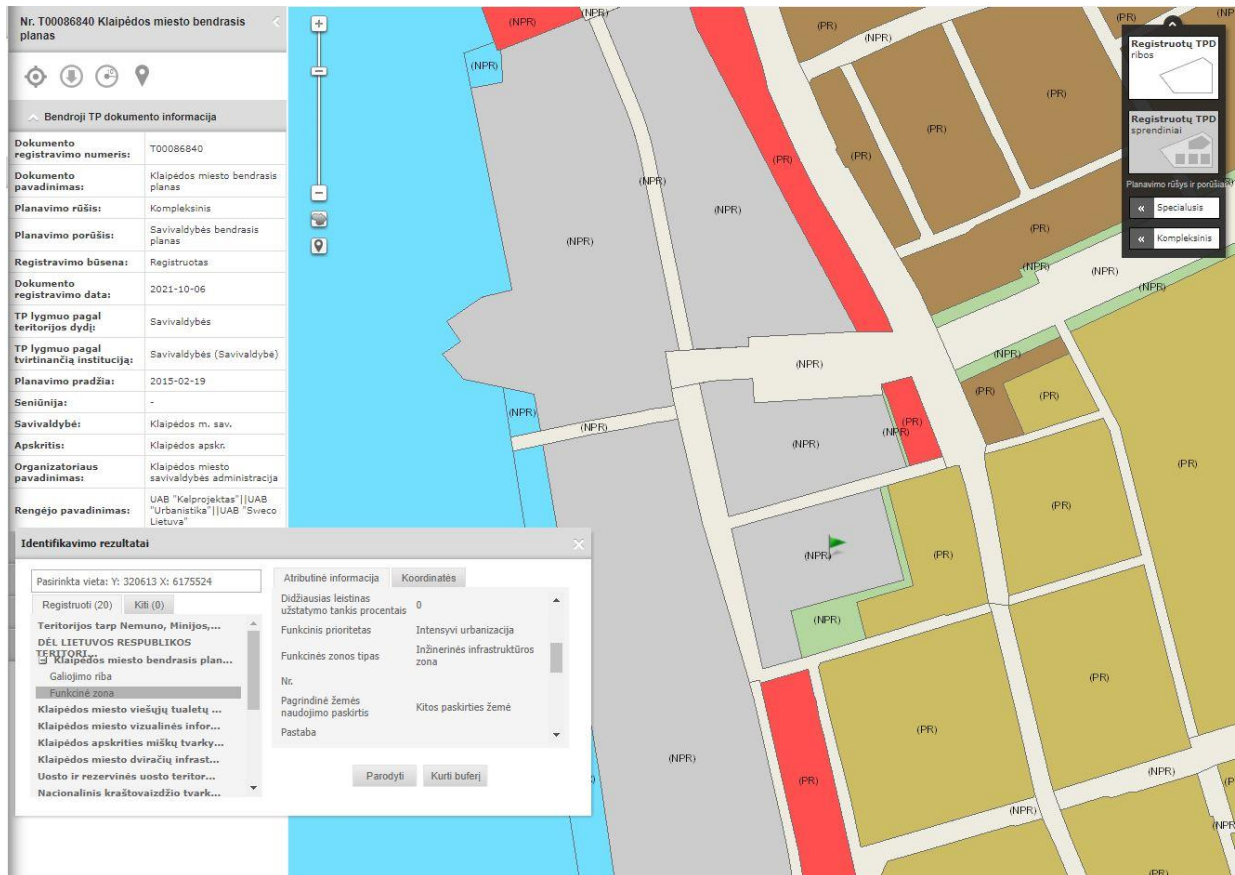
1 pav. Klaipėdos miesto bendrojo plano vektoriniai sprendiniai TPDRIS, www.tpdr.lt (detaliojo plano teritorija pažymėta žalia vėliavėle)

Vadovaujantis LR aplinkos ministro 2007-12-21 įsakymu Nr. D1-694 „Dėl atskirųjų rekreacinės paskirties želdynų plotų normų ir priklausomųjų želdynų normų (plotų) nustatymo tvarkos aprašo patvirtinimo“, jūrų uostų teritorijose, vidaus vandenų uostų ar stacionariųjų priplaukų teritorijose esančiuose žemės sklypuose taikoma 5 procentų plotų norma. Detaliojo plano korektūros sprendinių brėžinyje, greta planuojamos teritorijos, rytų ir pietryčių pusėje, pažymėtos atskirųjų želdynų teritorijos pagal Teritorijos tarp Jūreivių g., Poilsio g., Strėvos g. tęsinio, Mituvos g., Žalgirio g., Kalnupės g., Nidos g. ir Rambyno g. detaliojo plano, patvirtinto Klaipėdos miesto savivaldybės administracijos direktoriaus 2013 m. lapkričio 28 d. įsakymu Nr. AD1-2985, sprendinius.