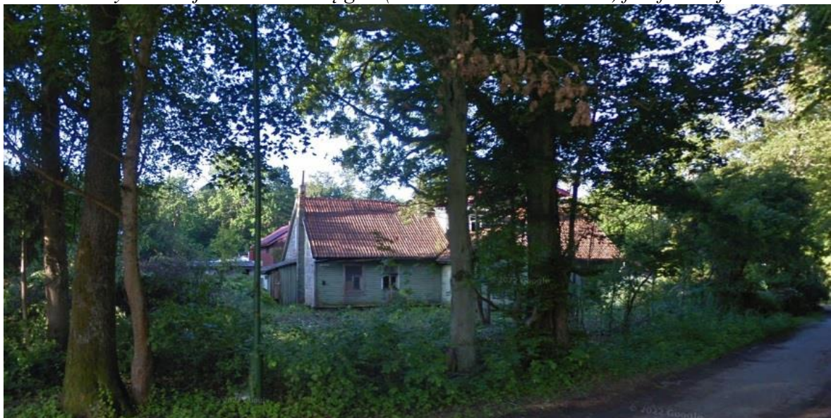
Gyvenamojo namo Turistų g. 1 (un. Nr. 2190-3000-6015) fotofiksacija