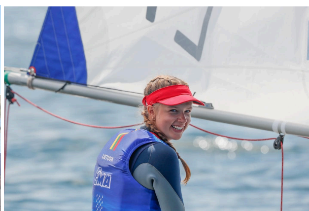
EurILCA Europa Cup 2022 2022 EurILCA Europa Cup POL JUNE 14-16 2022 | GDYNIA, POLAND