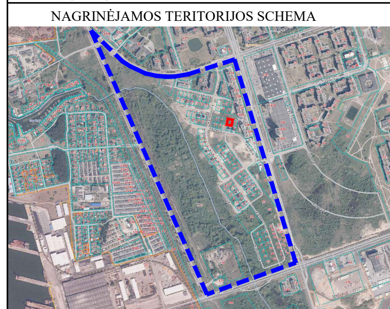
NAGRINĖJAMOS TERITORIJOS SCHEMA