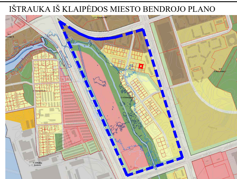
IŠTRAUKA IŠ KLAIPĖDOS MIESTO BENDROJO PLANO