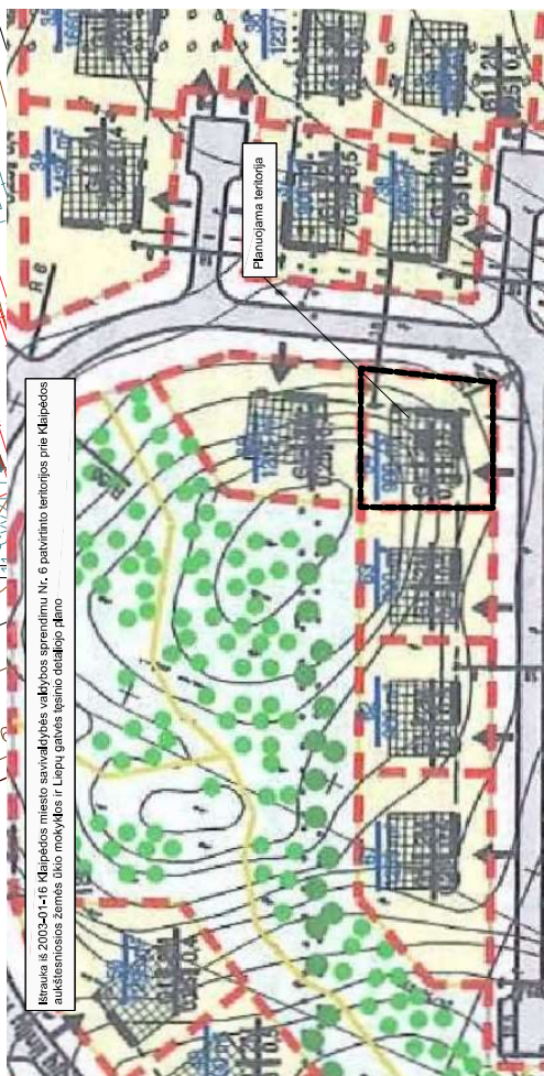
Mraucė & 2003-01-16 Klaipėdos miesto savivaldybės valdybos sprendimu Nr. 6 patvirtinto teritorijos prie Klaipėdos aukštesniosios žemės ūkio mokyklos ir Liepų gatvės tęsinio detaliu planu

PRITARTA: ..... (vardas, pavardė, parašas) ..... (vardas, pavardė, parašas)