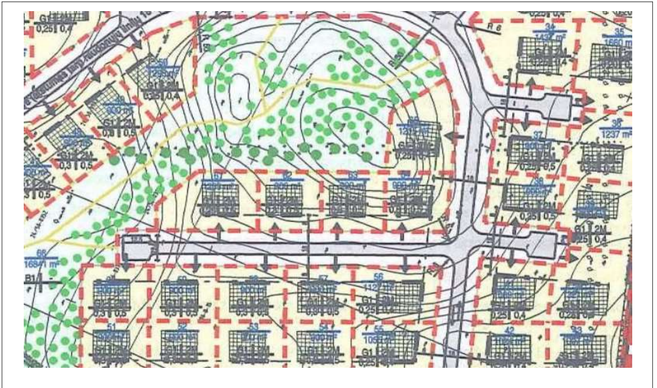
Ištrauka iš 2003-01-16 Klaipėdos miesto savivaldybės valdybos sprendimu Nr. 6 patvirtinto teritorijos prie Klaipėdos aukštesniosios žemės ūkio mokyklos ir Liepų gatvės tęsinio detaliojo plano koregavimo

Vadovaujantis 2003-01-16 Klaipėdos miesto savivaldybės valdybos sprendimu Nr. 6 patvirtinto teritorijos prie Klaipėdos aukštesniosios žemės ūkio mokyklos ir Liepų gatvės tęsinio detaliojo sprendiniais žemės sklype Užlaukio g. 20, Klaipėda nustatyti šie reglamentai: