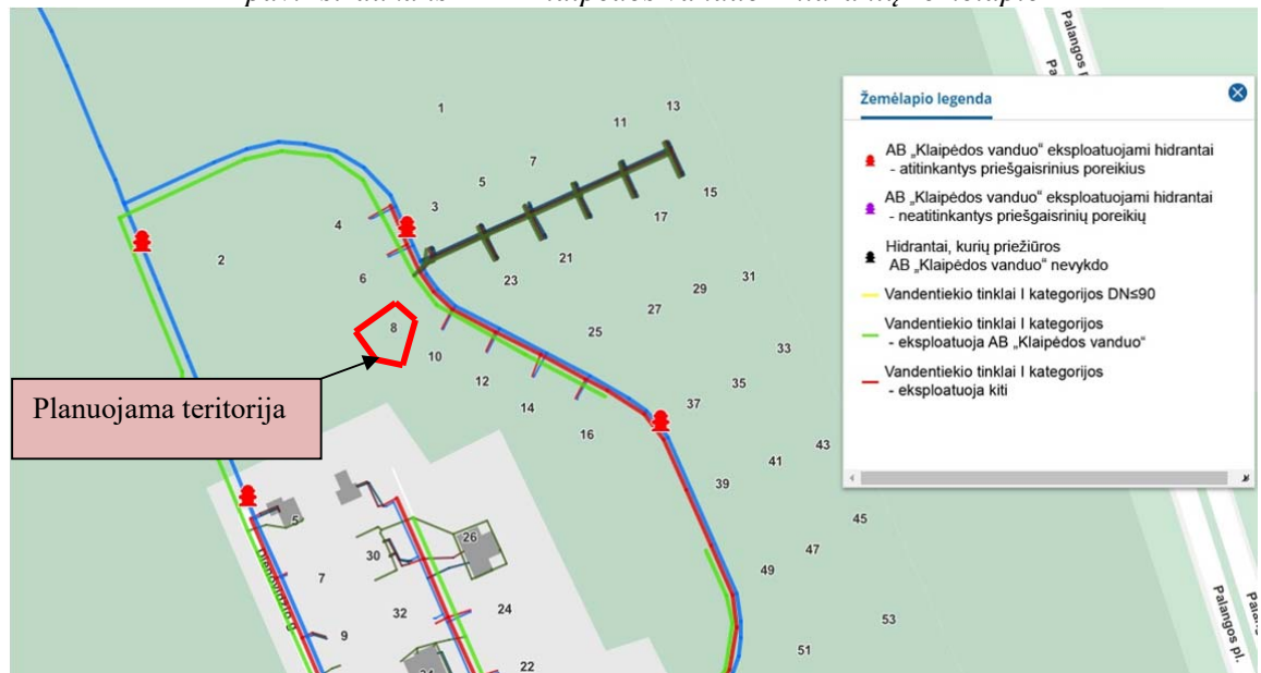
2 pav. Ištrauka iš AB „Klaipėdos vanduo“ hidrantų žemėlapiu