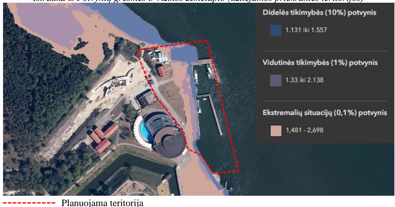
Ištrauka iš Potvynių grėsmės ir rizikos žemėlapiu (užliejamos priekrantės teritorijos)

*Kopgalio užkardos Smiltynės g. 2A detalusis planas, patvirtintas Klaipėdos miesto savivaldybės tarybos 2008 m. liepos 31 d. sprendimu Nr. T2-274 „Dėl Kopgalio užkardos Smiltynės g. 2A detaliojo plano patvirtinimo“.