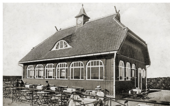
019633 Sandkrug, Stadtkreis Memel, MT02092-4. Strandhalle I. (1910-1920)

Smiltynė. Paplūdimio restoranas Strandhalle.