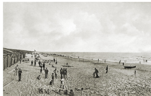
019673 Sandkrug, Stadtkreis Memel, MT02092-4. Badestrand II. (1910-1914)

Laikini paplūdimio lankytojų aptarnavimo statiniai buvo įprasti Smiltynės poilsiautojams. Siūloma plėtoti veiklą šia kryptimi, t.y. skatintini laikini poilsio, prekybos, maitinimo, nuomos statiniai ir kiti paplūdimio infrastruktūros įrenginiai.