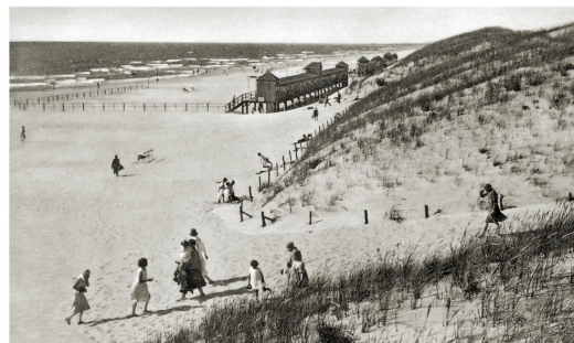
www.Bildarchiv-Ostpreussen.de 019875 Sandkrug, Stadtkreis Memel, MT02092-4. Badestrand III. (1937), © Fritz Krauskopf, Königsberg

Smiltynės pajūryje plėtojant rekreaciją, jautrų kopagūbrio reljefą sutvirtinti, naudojant istorines priemones – apželdinimą, pynimą ir pan.