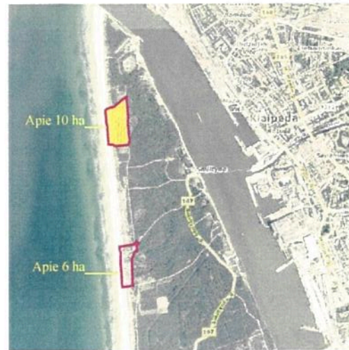
Planuojamos teritorijos situacijos schema