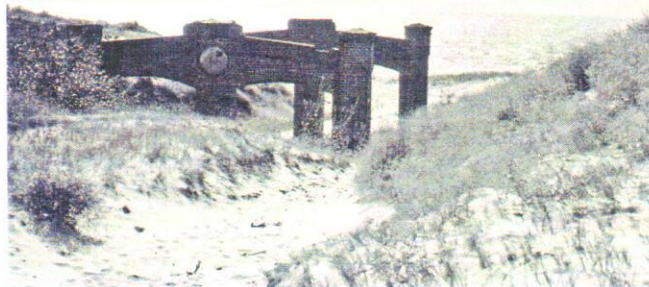
V. Tamošiūno nuotrauka, 1971 m.

Tikslinga atstatyti mūrinį laivų gelbėjimo stoties pastatą.