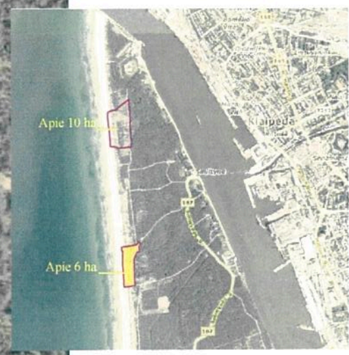
Planuojamos teritorijos situacijos schema

PATVIRTINTA Klaipėdos miesto savivaldybės Tarybos 2014 m. 06 m. 23 d. sprendimu Nr. T2-851 Savivaldybės Tarybos sekretoriatas (A) Artezinis gręžinys (B) Žmonėms su negalia pritaikytas konteinerinis tualetas