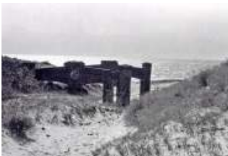
1971 m.

Tvarkymo plano sprendinių brėžinyje pažymėti keli rekreacinės infrastruktūros objektai- paplūdimio aptarnavimo centras prie pėsčiųjų ir dviračių tako bei gelbėjimo stotis ant apsauginio pajūrio pylimo, kur prieškaryje yra stovėjusi raudonų plytų laivų gelbėjimo stotis (sugriauta apie 1980 metus). Iš V.Tamošiūno 1971 metų nuotraukos matyti, kad stotis buvo tipinė, tokia pati yra išlikusi Nemirsetoje (Klaipėdos rajonas).