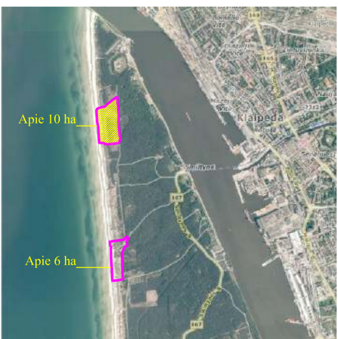
Planuojamos teritorijos situacijos schema

SPECIALIOSIOS ŽEMĖS IR MIŠKO NAUDOJIMO SĄLYGOS SKLYPUI Nr.1 XX- požeminių vandens telkinių (vandenviečių) sanitarinės apsaugos zonos- vandens gręžinio SAZ 1-oji juosta- griežto režimo apsaugos juosta (R 5m)- 78,5m 2 . Apsaugos juostos nustomos, vadovaujantis HN 44:2006. XXXIII- rekreacinės teritorijos. Visas sklypas- 2000 m 2 . XXXIV- nacionaliniai ir regioniniai parkai. Visas sklypas- 2000 m 2 . XLIX- vandentiekio, lietaus ir fekalinės kanalizacijos tinklų ir įrenginių apsaugos zonos. Vandentiekio- 249 m 2 , nuotekų- 141 m 2 .