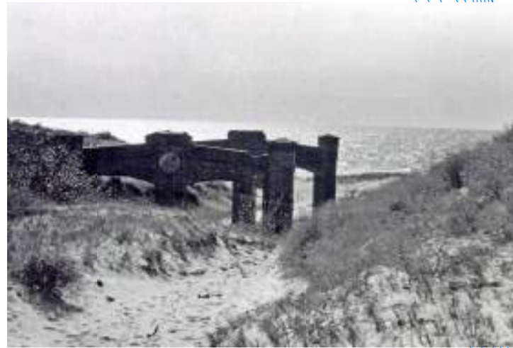
Laivų gelbėjimo stoties pastato liekanos. V. Tamošiūno nuotrauka, 1971 m.