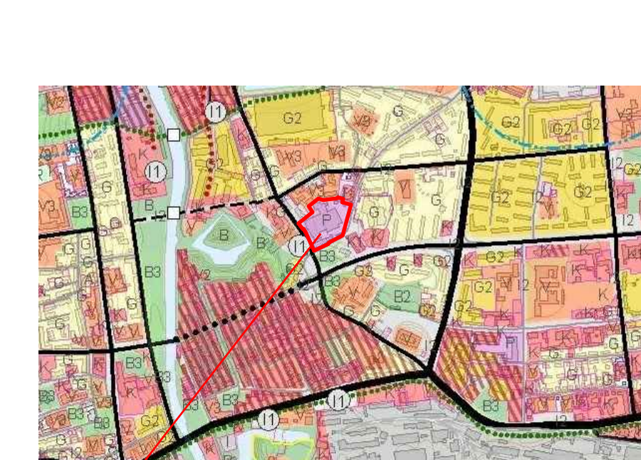
ISTRAUKA IŠ KLAIPĖDOS M. BENDROJO PLANO Miesto teritorijų funkcinių prioritetų brėžinio (BE MASTELIO)