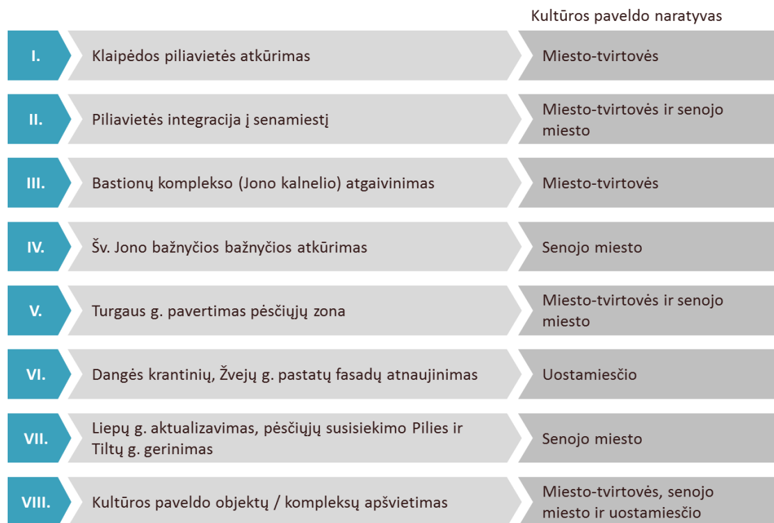
Pav. 1: Klaipėdos miesto kultūros paveldo naratyvų sujungimo ir aktualizavimo koncepcijos veiksmų planas