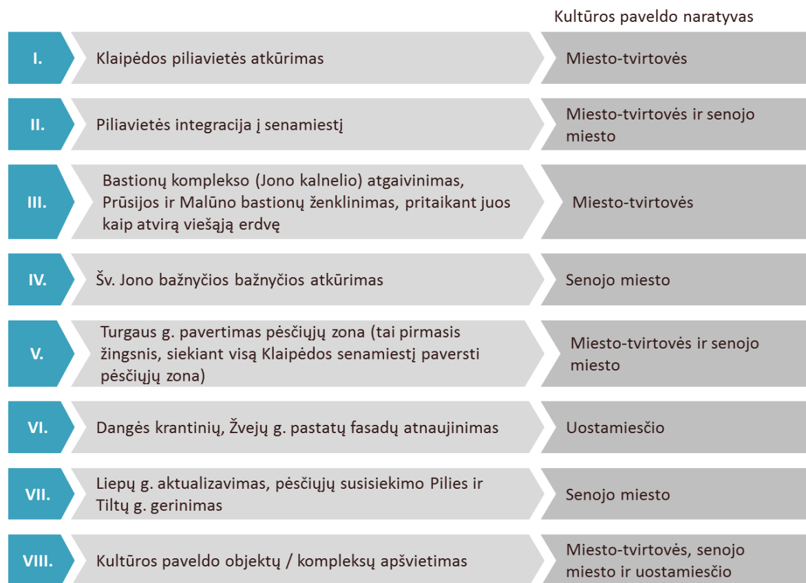
Pav. 1: Klaipėdos miesto kultūros paveldo naratyvų sujungimo ir aktualizavimo koncepcijos veiksmų planas