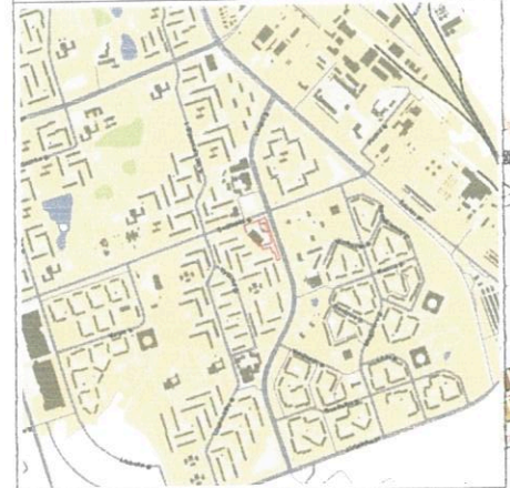
ŠTRAIKA IŠ APIE 166 HA GYVENAMŲJŲ DAUGIABUČIŲ NAMŲ KVARTALŲ TERITORIJOS, RIBOJAMOS JŪRININKŲ PR., SILUTES PL., SMILTĖLES G. IR LUBEIKO G., KLAIPĖDOJE, DETALIOJO PLANO