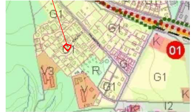
ĮŠTRAUKA IŠ KLAIPĖDOS M. BENDROJO PLANO MIESTO TERITORIJŲ FUNKCINIŲ PRIORITETŲ BRĖŽINIO (BE MASTELIO)