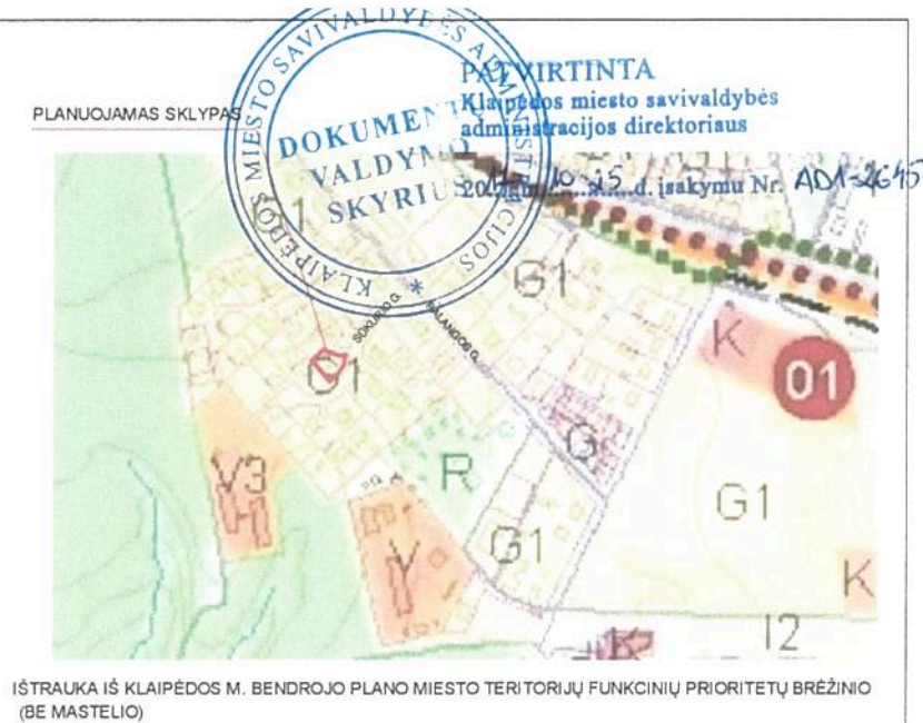
IŠTRAUKA IŠ KLAIPĖDOS M. BENDROJO PLANO Miesto teritorijų funkcinių prioritetų brėžinio (BE MASTELIO)