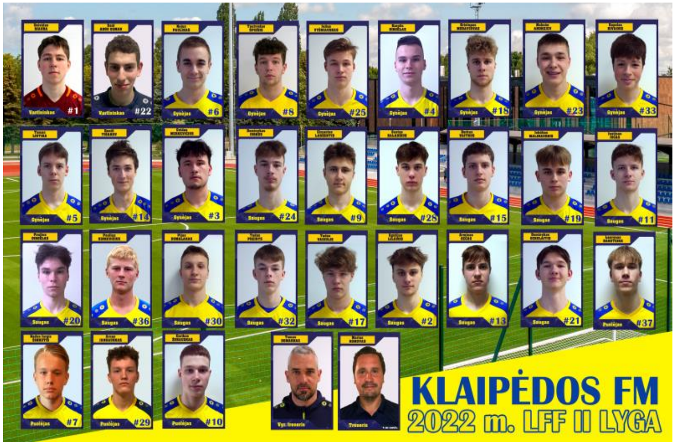
3 pav. Klaipėdos futbolo mokyklos komanda 2022 m. LFF II lygos čempionate

Užtikrindami ugdymo piramidės viršūnę, antrą kartą mokyklos istorijoje dalyvavome LFF II lygos čempionate. Padarytas didelis žingsnis į priekį. 16-18 metų auklėtiniai tarp 18 komandų čempionate užėmė 7 vietą (2021 m. – 15).