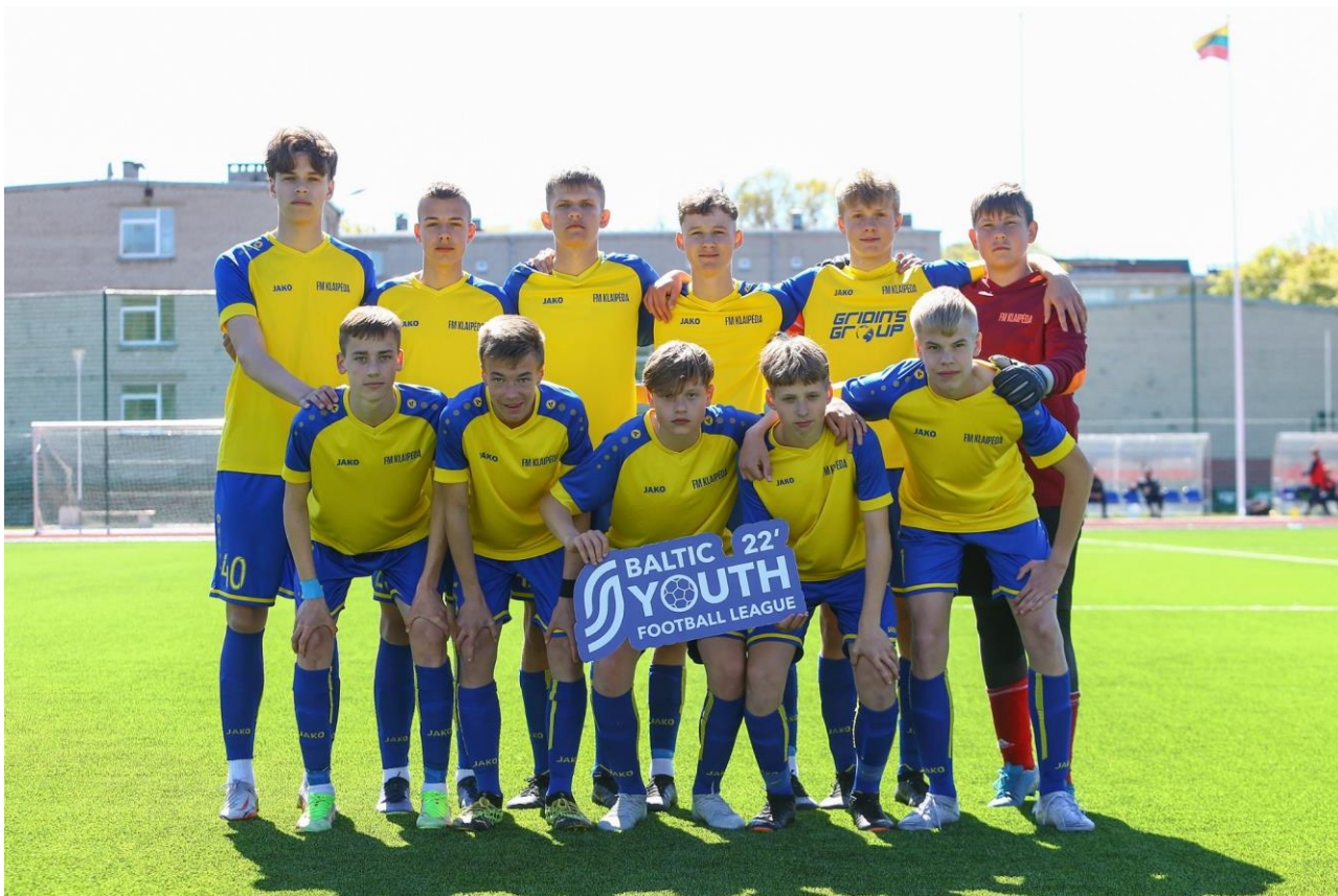
4 pav. Klaipėdos futbolo mokyklos U-15 komanda 2022 m. Baltijos jaunių lygoje

Praėjusiame 2022 m. futbolo sezone pasiekti aukšti rezultatai. Oficialiuose LVJUFA rengiamuose čempionatuose beveik visose amžiaus grupėse klaipėdiečiai yra tarp prizininkų, o U-13 FM ekipa tapo Lietuvos čempione.