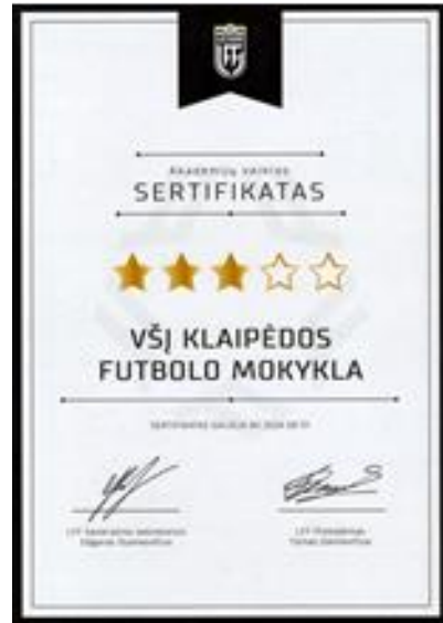
2 pav. VŠĮ Klaipėdos futbolo mokyklai suteiktas sertifikatas.

Mokykla labai sėkmingai dalyvavo ir kitoje programoje „Lietuvos jaunimo integracija į profesionalų vyrų futbolą“. Tarp visų II lygos komandų Klaipėdos FM tapo šios programos nugalėtoja.